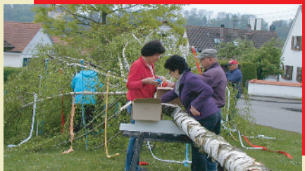
Samstag, 30.04.16 Maibaumfeier, 19 Uhr Dorfplatz bei Bushaltestelle, anschließend Hocketse