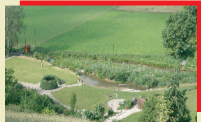
Samstag, 06.08.16 Sommernachtsfest Sonntag, 07.08.16 Familientag, Nah.-Anlage