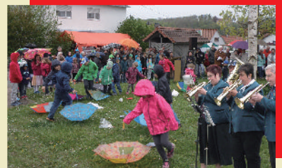
Samstag, 30.04.16 Maibaumfeier mit anschl. Maihock, 19 Uhr Dorfplatz bei Bushaltestelle