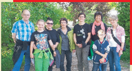
Freitag, 06.05.16 Maiwanderung, 18 Uhr, Lindenau Treffpunkt Wanderparkplatz Bissingen