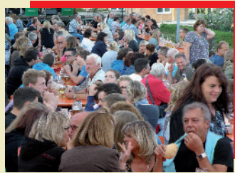
Samstag, 01.07.16 Sonntag, 02.07.16 Burgberger Dorffest bei Maria-von-Linden-Halle